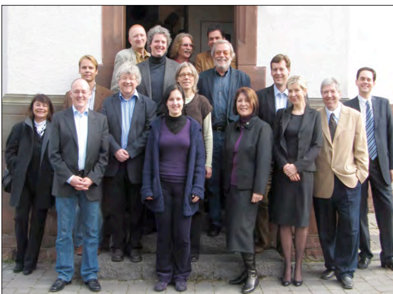
BIOS/FAB –Team Behandlungsstützpunkt Mannheim

Nachdem wir am 1. August 2009 unseren ersten Behandlungsstützpunkt in Offenburg auch offiziell in Betrieb genommen haben, ist dank der Unterstützung der Justizvollzugsanstalt Mannheim am 19. März 2010 ein zweiter Stützpunkt in Mannheim mit vier großen von uns