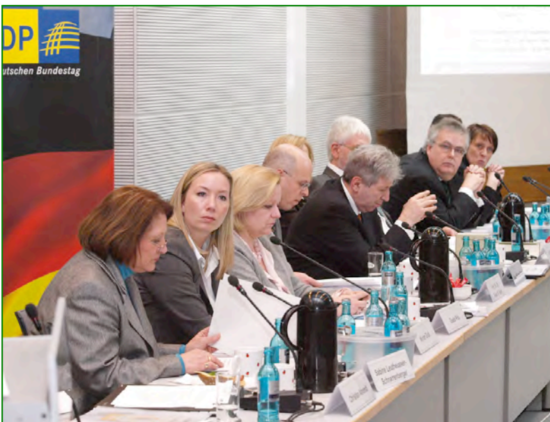
Sachverständigen-Anhörung bei der FDP-Bundestagsfraktion am 17. März 2010

Danach soll die Gefährlichkeit eines Gewalt- und Sexualstraftäters bereits in der gerichtlichen Hauptverhandlung durch Zuziehung eines Sachverständigen geklärt werden, um damit einerseits den Strafvollzug zu unterstützen und andererseits zu verhindern, dass vorhandene psychische Störungen unerkannt bleiben und die Täter trotz Indikation unbehandelt aus der Haft entlassen werden. Auch soll es die Möglichkeit der Anordnung von Therapien durch den Richter bereits im gerichtlichen Erkenntnisverfahren geben. Aufgrund der öffentlichen Aufmerksamkeit unseres Anliegens sind wir am 17. März 2010 zu einer Sachverständigen-Anhörung der FDP-Bundestagsfraktion nach Berlin eingeladen worden.